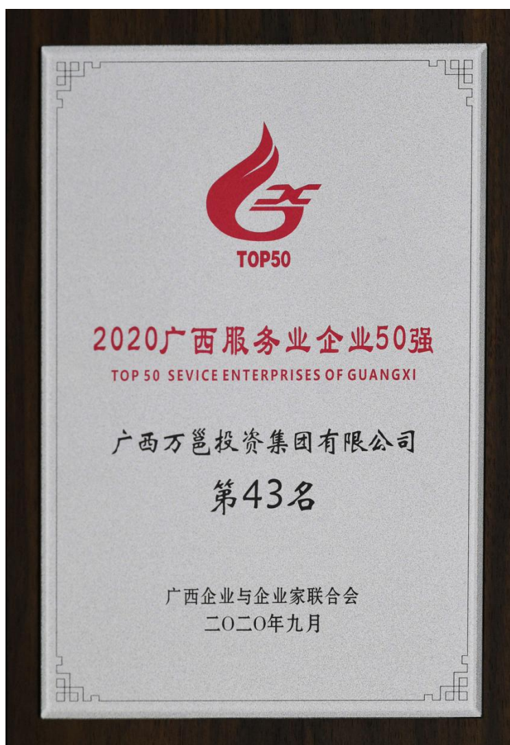
(2020 年公司荣获广西服务业企业 50 强)

万邕集团一直秉承“万众一心、勇往直前”的企业精神，始终恪守“诚信守法、争创效益”的经营理念，时刻牢记“重信兴利、共赢发展”的企业宗旨，积极践行“精诚、品质、创新”的核心价值观，继续围绕电力发展，在新能源等领域加大建设力量，努力实现企业和股东双赢，为实现社会的美好繁荣，为实现中华民族伟大复兴“中国梦”而努力奋斗。