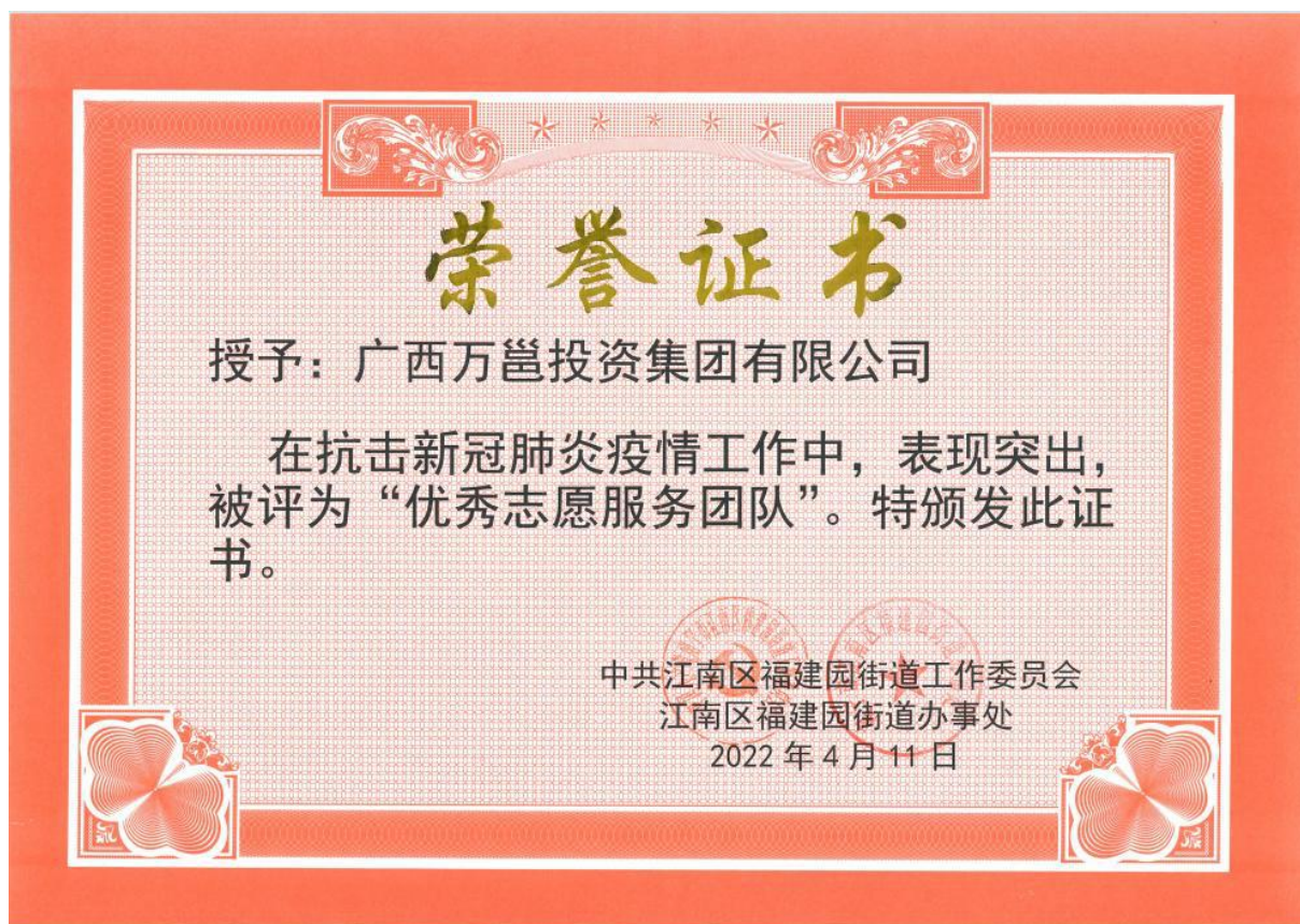
(2022年公司荣获“优秀志愿服务团队”荣誉证书)