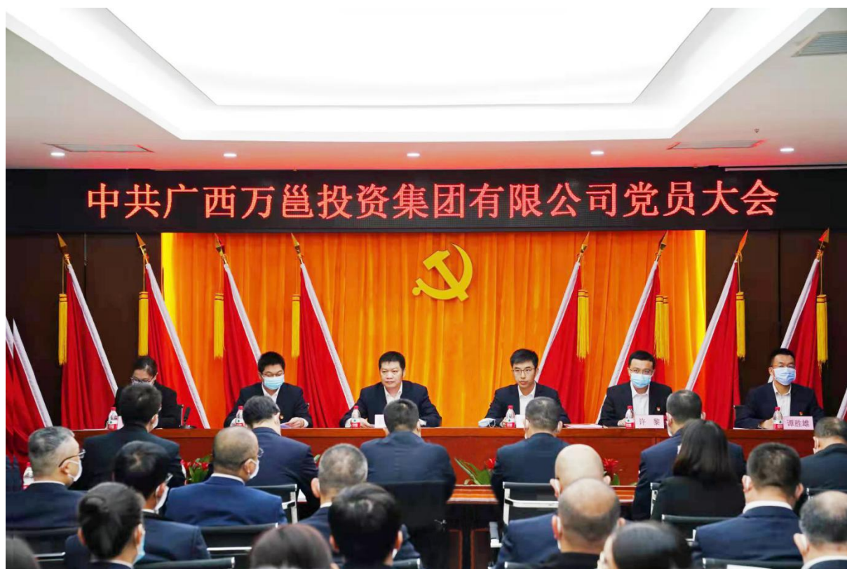
(公司召开党员大会)