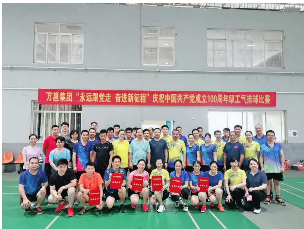
(公司组织“永远跟党走，奋进新征程”气排球比赛)